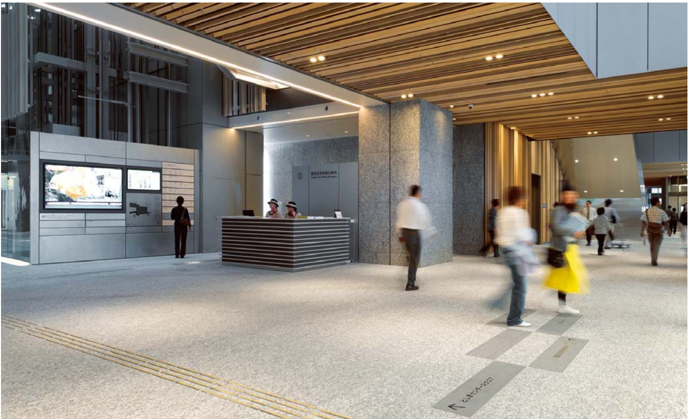
TOSHIMA ECOMUSEE TOWN としまエコミュージゼタウン サイン計画 2015