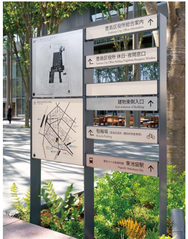
TOSHIMA ECOMUSEE TOWN としまエコミュージアムタウン サイン計画 2015